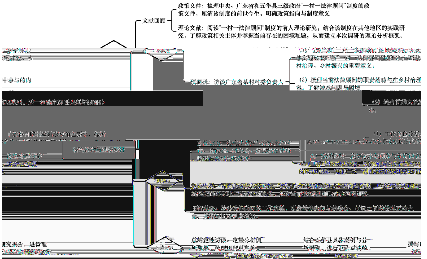
图表 研究方法 与调研安排简图